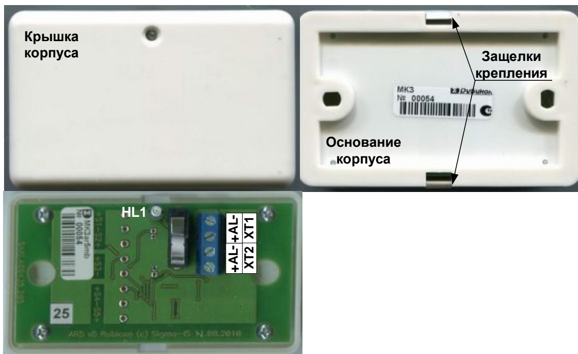
Рис. 1 МКЗ. Расположение элементов

В корпусе предусмотрены два отверстия для крепления устройства шурупами к поверхности, на которой он устанавливается.